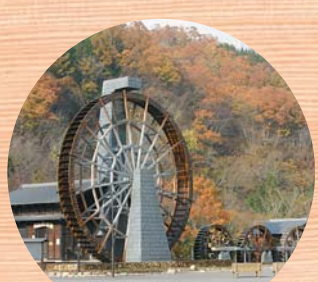
そばの里五連水車