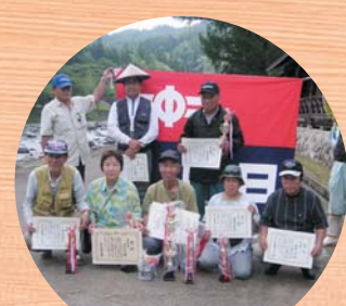
あまご・やまめ釣り大会