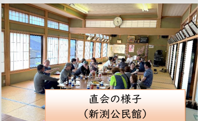
直会の様子 (新湊公民館)