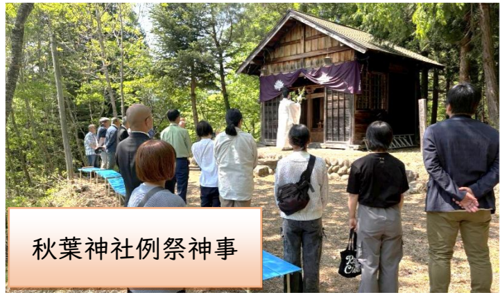
秋葉神社例祭神事