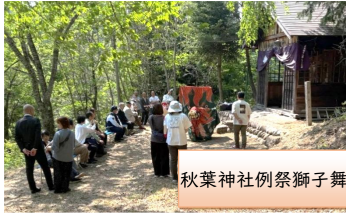
秋葉神社例祭獅子舞