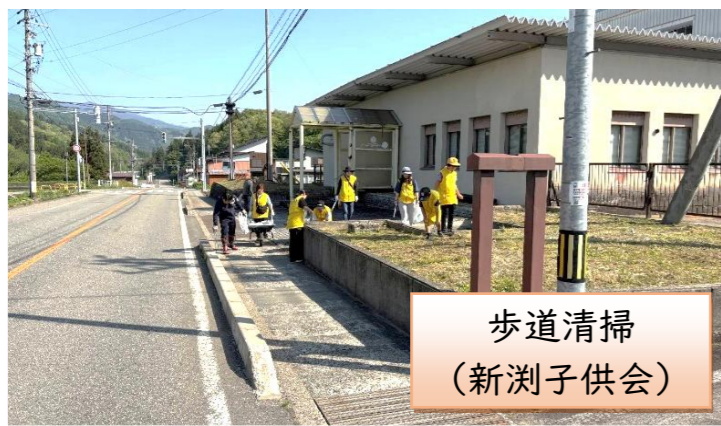
歩道清掃 (新湊子供会)