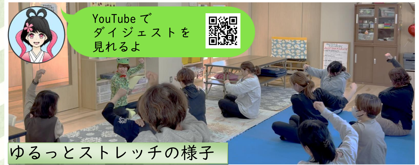
ゆるっとストレッチの様子

体調を整える「ゆるっとストレッチ」健康的に痩せる「食事の仕方」 代謝を上げる 「みそ汁の濃度」など、具体的なダイエット方法を学びました。10名の参加者は全員、「こんな簡単なダイエット方式は初めて!」「とても健康的!」「自分にも続けられそう」など、口をそろえて感動していました。 次回は2/8(日)に開催する予定です。 詳しくは1月下旬ごろお知らせします。