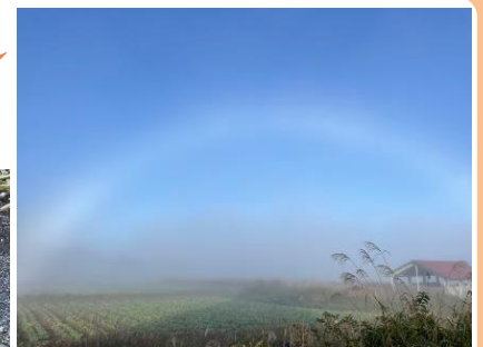
白い虹です。幻想的ですね。 (黒谷ダナ高原)

『町民ひろば』の記事募集中。 どんなことでもお知らせ下さい。 お待ちしております♪