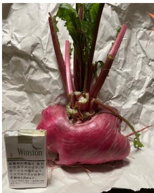
BIG 赤カブ! なんて大きいの! (寺河戸)