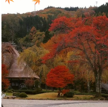
荘川の里の紅葉です。