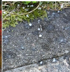
見て!見て! ヒョウが降りました!