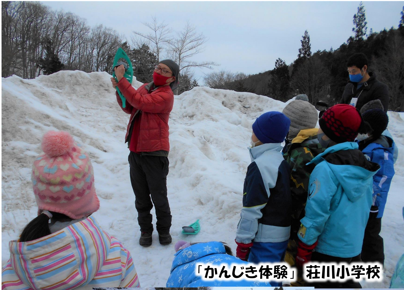
「かんじき体験」 荘川小学校