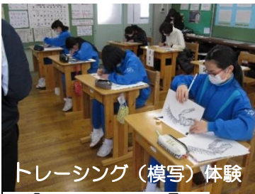
トレーシング(模写)体験