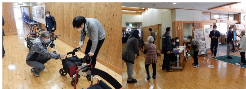
介護用具の説明を受ける様子