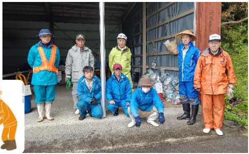
ゴミの集積場にて