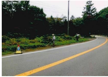
牛丸・岩瀬町内会

今年はコロナ禍で荘川への来客が減少して寂しいですが、作業によりガードレールからはみ出していた雑草が刈り取られすっきりしました。ご苦労様でした!