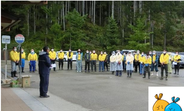
作業前のミーティング

今回は飛騨地区郵便局長の皆さんのご協力も頂き、たいへん綺麗になりました。ありがとうございました!