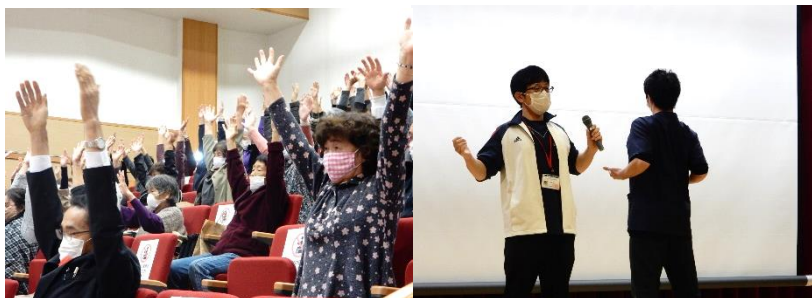
肩の凝りをほぐす体操の実演