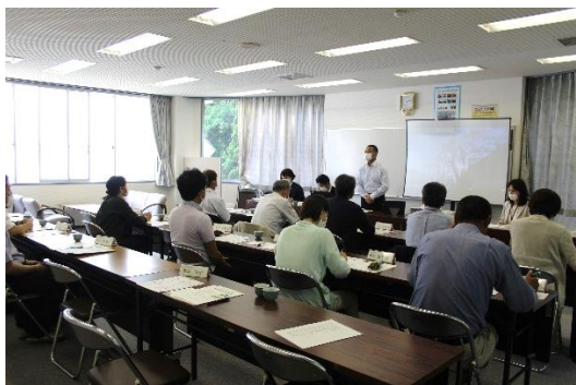
基本方針の説明と意見交換会

荘川地域は今までも、地域・学校・家庭の連携の中で子育てに取り組んできましたが、今後はその流れを継続しながら更に学校・地域が協働で地域の創意工夫を生かした特色ある学校づくりを目指していきます。今後子ども達が様々な学びの中で、時には「地域の先生」として地域の皆様に協力を願うこともあると思いますが是非ご協力ください。