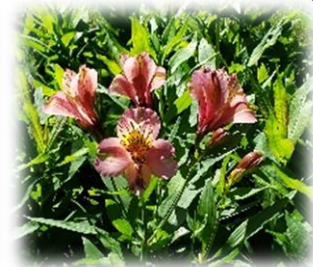
アルストロメリア