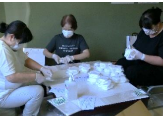
マスクの封入作業

このことから感染予防の一助になればとの思いで、各地区の協力員のご協力のもと、65歳以上の方にマスクを配布することとしました。