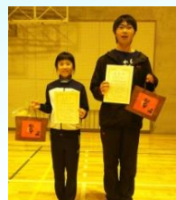
紅白戦ベストペア