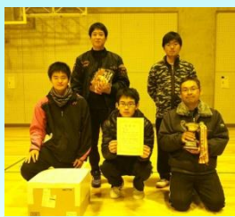
男子ダブルス優勝者