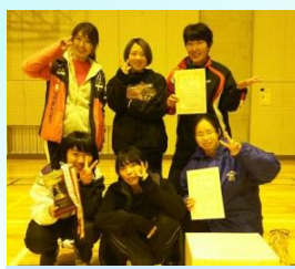
女子ダブルス優勝者