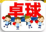
参加者加者の皆さん 「楽しく卓球をしました!!」