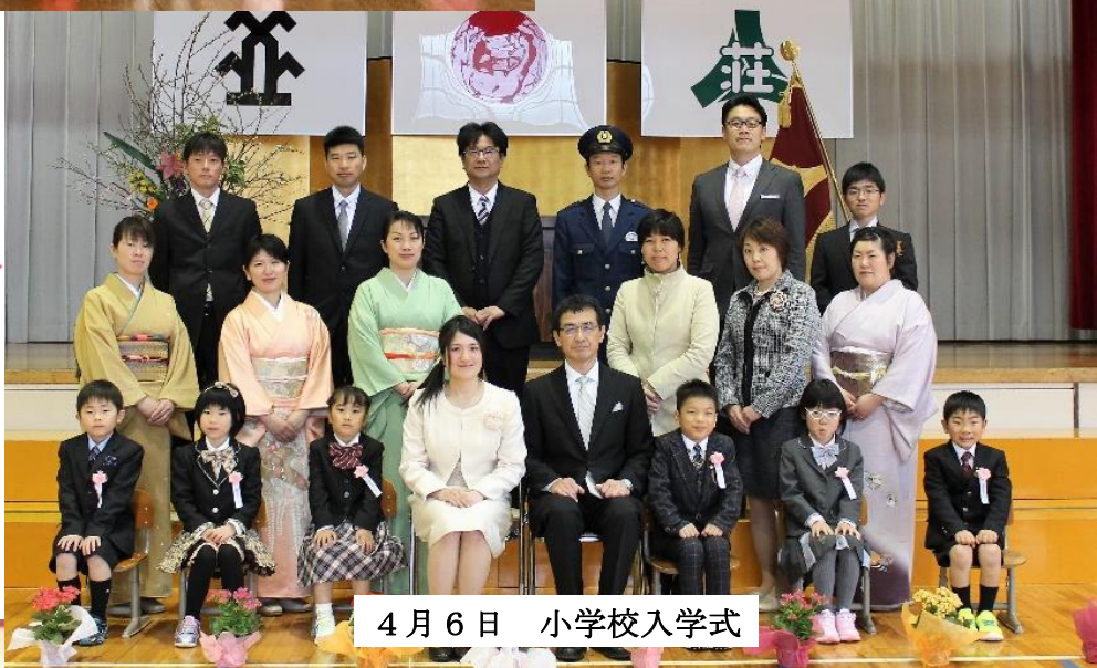
4月6日 小学校入学式