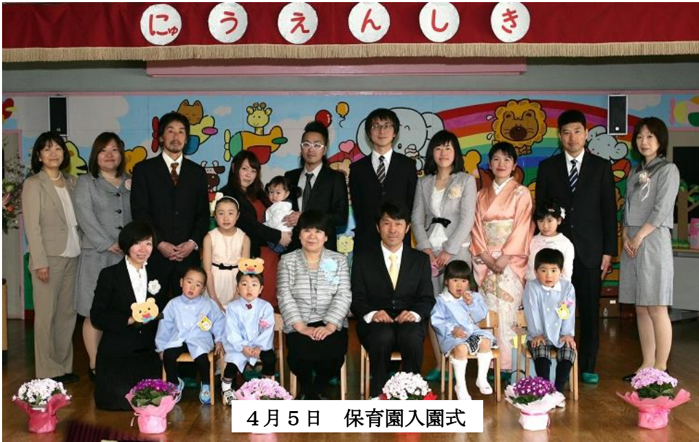
4月5日 保育園入園式