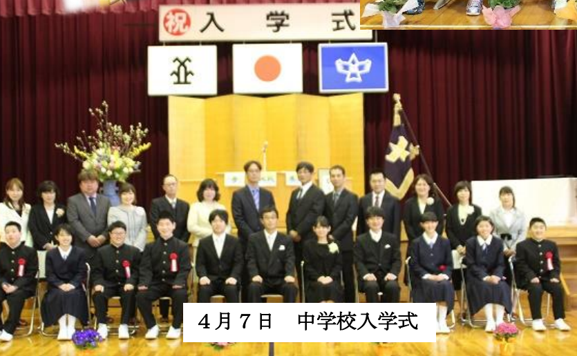
4月7日 中学校入学式