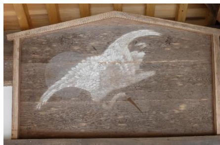
例祭に掲げられた絵馬（安政3年）