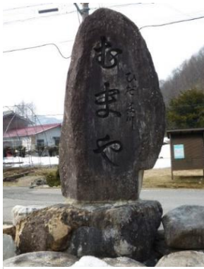
国道 158 号の石碑

へ向こう通るは金山 かみやま のお衆か 金がこぼれるたもどから へ西ヶ洞から聞こえる音は あれは黄金 こがね を杵 きね で割る