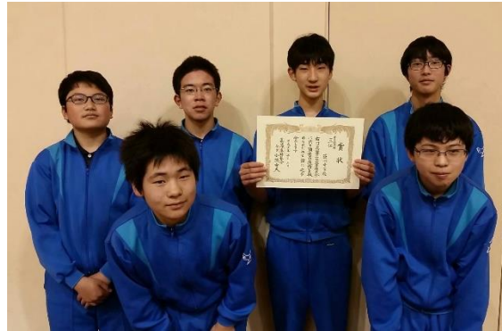
荘川中学校卓球部(男子)の皆さん

高山市中学生卓球大会 (5月3日) ▽ビックアリーナ 【中学校団体男子の部】 3位 荘川中学校