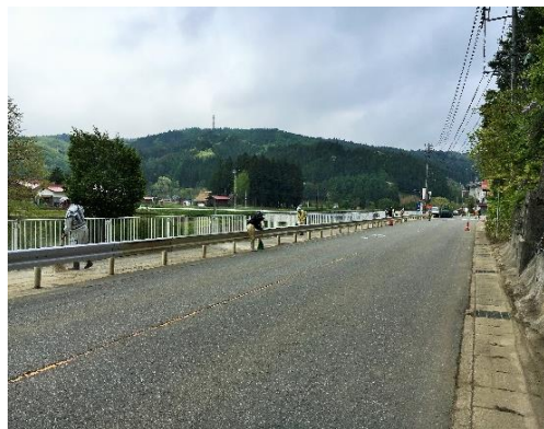
道路沿いを清掃する地域の方々(惣則地区)