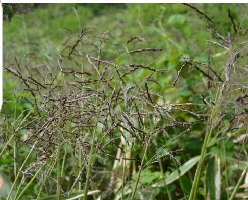
三谷地区にて撮影