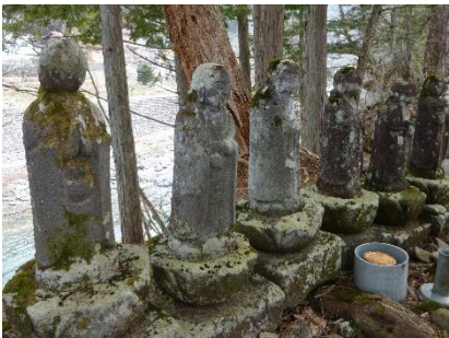
旧町屋橋のふもとにある六地藏